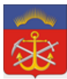
Министерство образования и науки Мурманской области