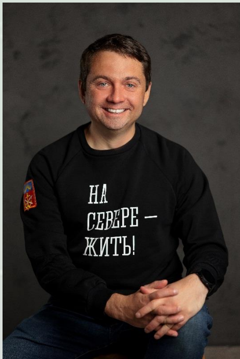
Андрей Владимирович Чибис Губернатор Мурманской области