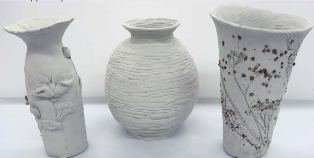
Детские работы. Декоративные вазы, созданные методом спирального навива из жгутов и техники лепки из пласта, ручная формовка, шамотная необожжённая глина

Понятие «керамика» включает все разновидности изделий, выполняемых из глины.